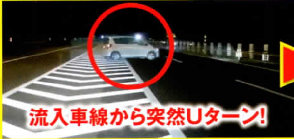
流入車線から突然Uターン!