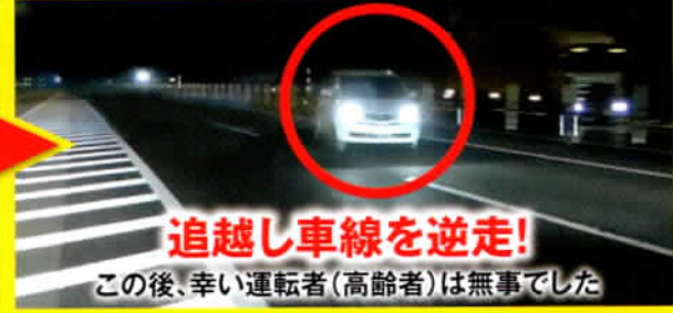
追越し車線を逆走!