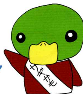
青森県警察 特殊詐欺被害防止キャラクター 「サギかもくん」